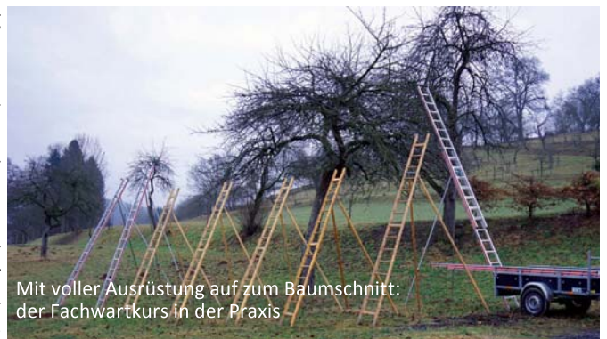
Mit voller Ausrüstung auf zum Baumschnitt: der Fachwartkurs in der Praxis

durch Vermarktung und Genuß erhalten: Apfelsaft, Apfelwein, Apfelbrände, Apfelmehrus und vieles mehr. Wissen über Ernährung mit regionalen Produkten wird durch Vernetzung von Experten gebündelt: der Verein bietet zur Pflege der Baumbestände einen Fachwartkurs für Obstbaumpflege an und strebt die Einrichtung einer Apfelsortenbank Odenwald an.