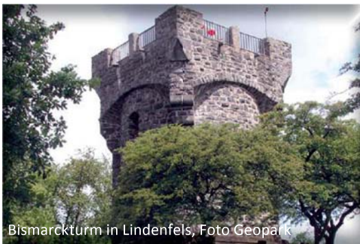
Bismarckturm in Lindenfels

men bergen einen besonderen Schatz. Sie sind Zeugnis längst vergangener Lebewelten und erinnern daran, daß