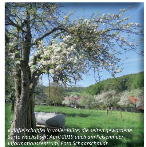
Kalbfleischapfel in voller Blüte; die selten gewordene Sorte wächst seit April 2019 auch am Felsenmeer-Informationszentrum