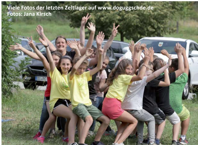
Viele Fotos der letzten Zeltlager auf www.doguggschde.de

☀ bei den neuen Helfern, die in diesem Jahr das Team tatkräftig unterstütz- t haben und bei allen erfah- renen Helfern und Betreu- ern für ihre engagierte ehrenamtliche Arbeit, vor- während und im Anschluß